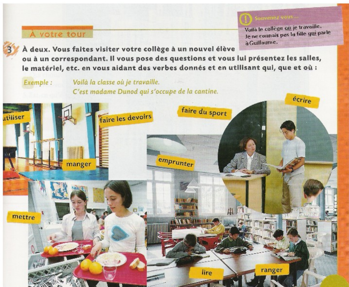
C. Bergeron, M. Albero et M. Bidault : Tandem , niveau 2, Didier, 2003, page 23.

– Dans l'approche communicative, l'aire privilégiée est la C (la simulation d'actions, sous forme de présentation d'un sketch ou jeu de rôles par les élèves eux-mêmes), l'étayage étant réduit (du moins dans les manuels qui systématisent cette approche) au strict minimum, que ce soit en termes de préparation (a1), soutien (a2) ou reprise (a3). La page du manuel Tandem (Didier, 2003) présentée ci-après me semble en fournir un bon exemple 9 :